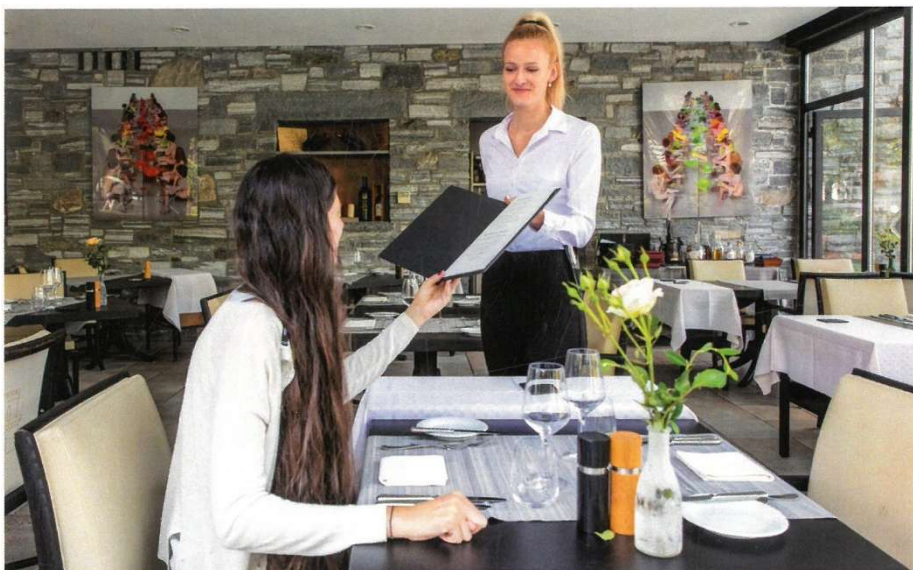
Restaurantfachmann/-frau EFZ Restaurantangestellter/-angestellte EBA

Diese Berufsleute kümmern sich um die Gäste in Hotels und Restaurants. Sie beraten diese bei der Auswahl von Speisen und Getränken und servieren ihnen das Gewünschte. Ausserdem dekorieren sie Tische, kassieren Beträge und sie bestellen, kontrollieren und lagern Waren. In EBA-Grundbildungen ist der Unterricht einfacher und der Fokus liegt auf praktischen Fertigkeiten.